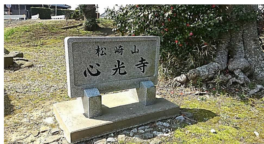
さびれたお寺 墓石も古くて檀家なしか？ 仏閣なし、なかなか見つからなかった。