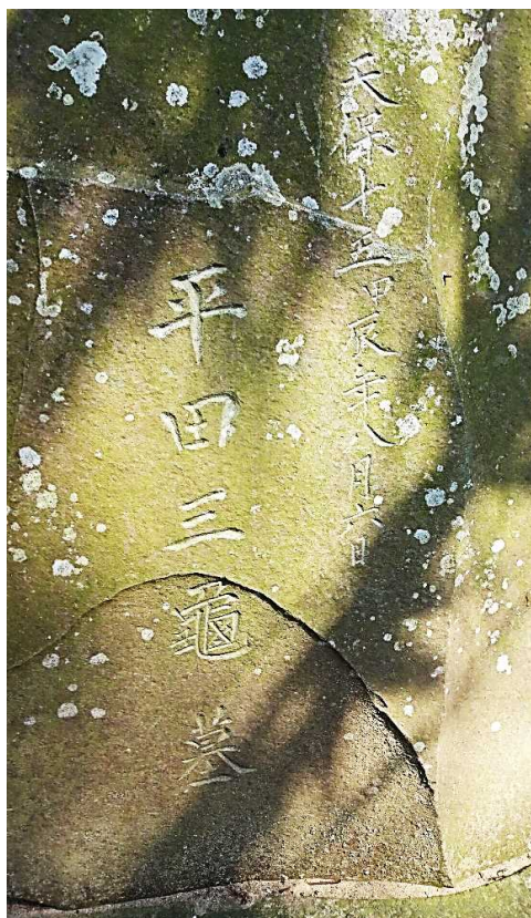
天保15年甲辰8月16日 平田三龜